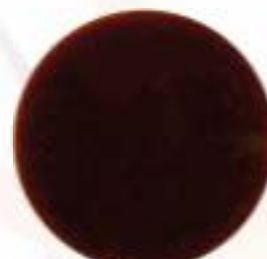
Poke mayo special