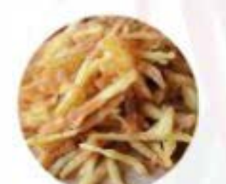
Filange di patate