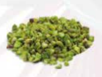
Granella di pistacchio