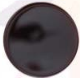
Soia (senza glutine)