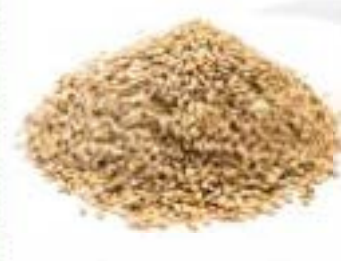
Semi di sesamo