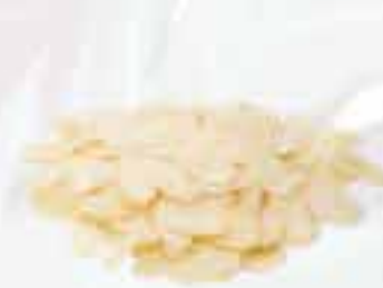
Mandorle a scaglie