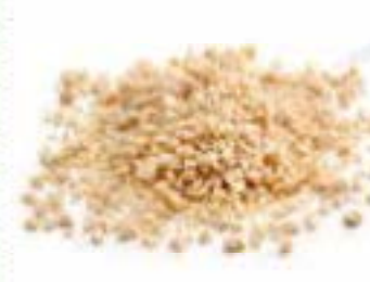
Granella di arachidi