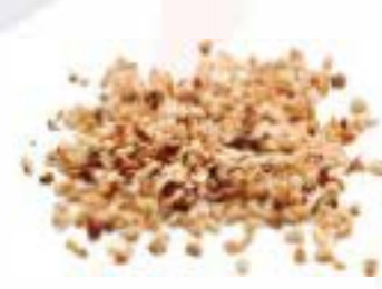
Granella di nocciole