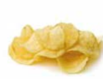
Chips di patate